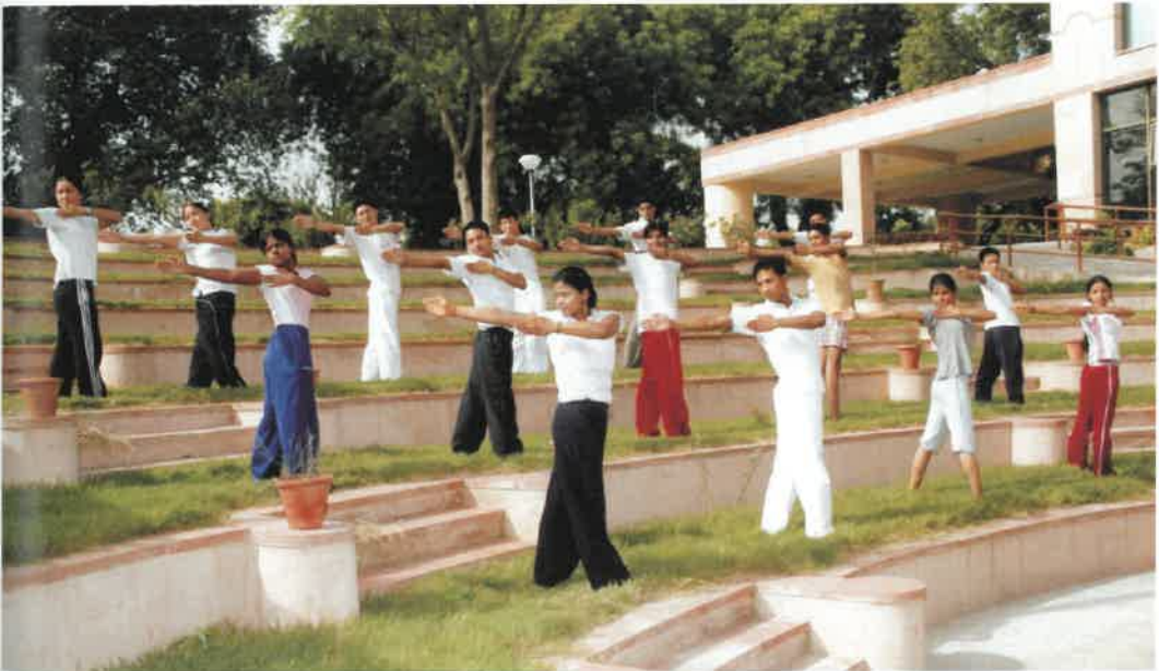
DYS Students Practicing Yoga