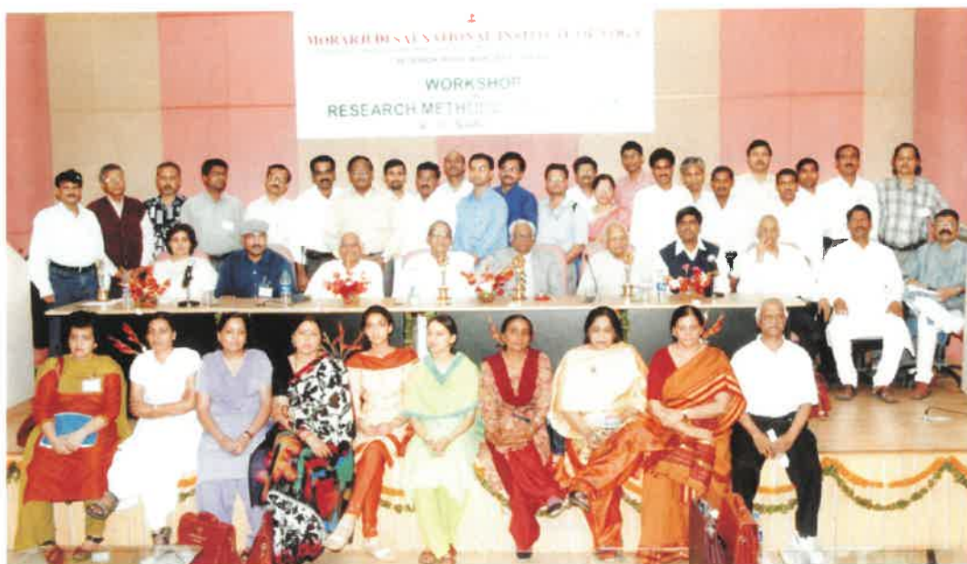
Participant and Resource persons participated in workshop on Research Methodology in Yoga