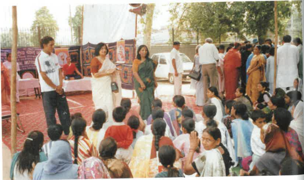
Bhagidari Programme of Govt. of NCT of Delhi