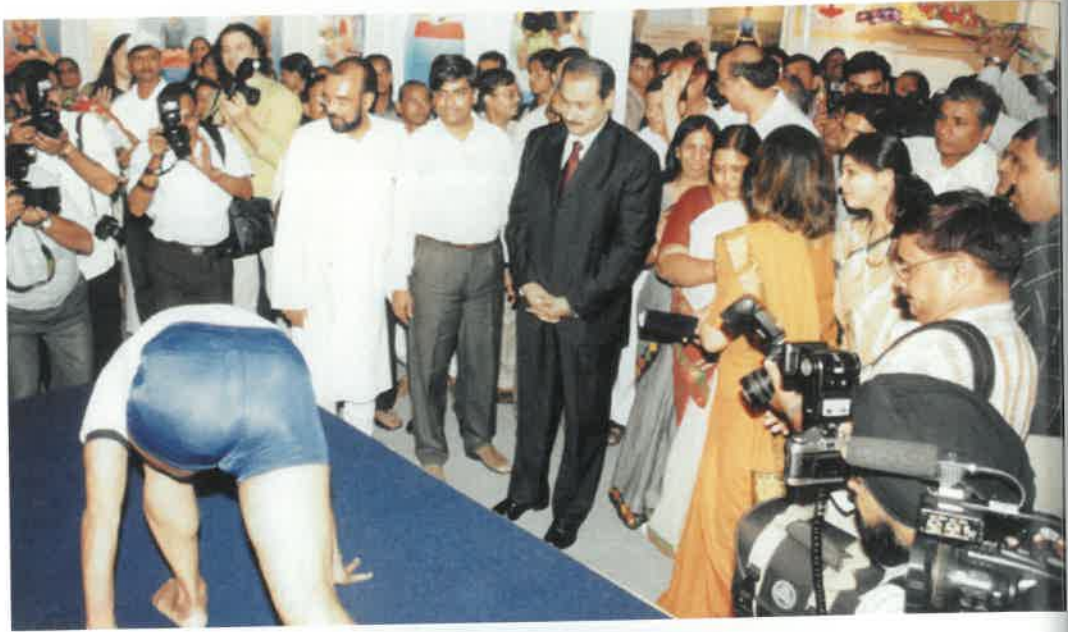
Arogya - 2005 New Delhi