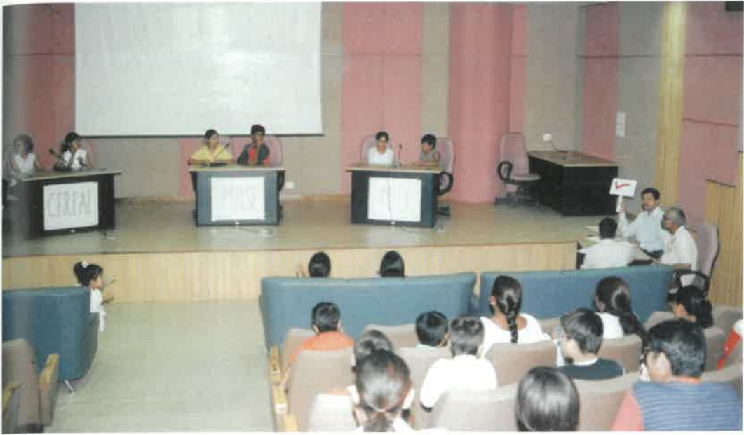
Yoga Workshop for Children