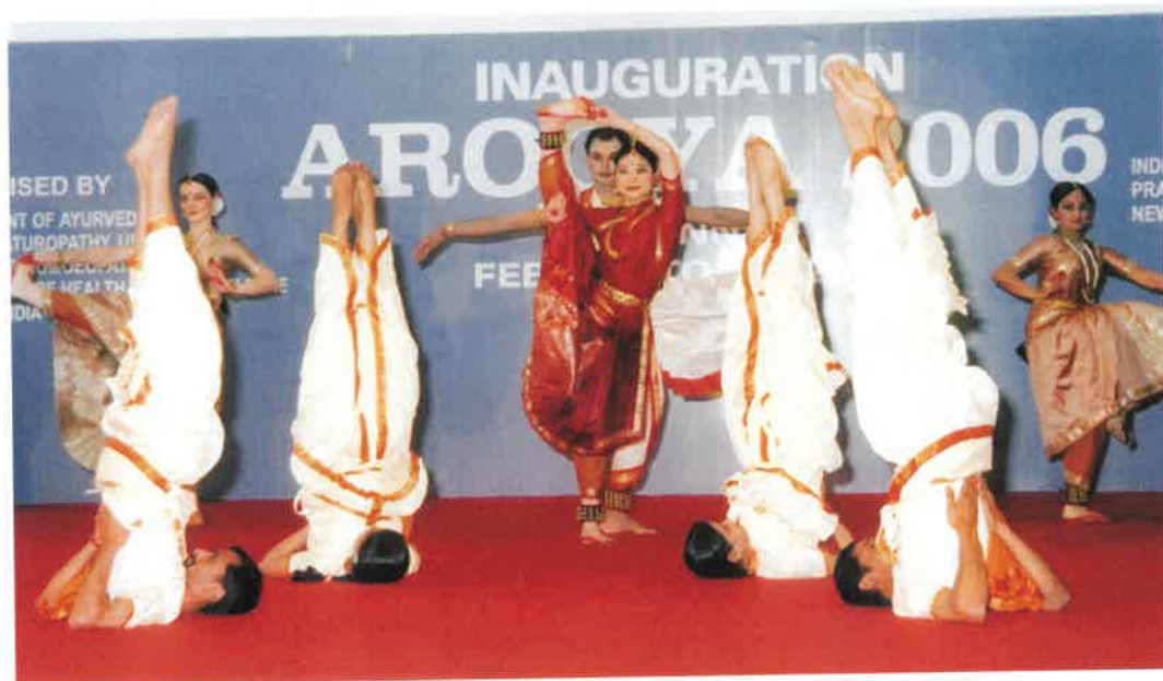
Arogya 2006, Chennai