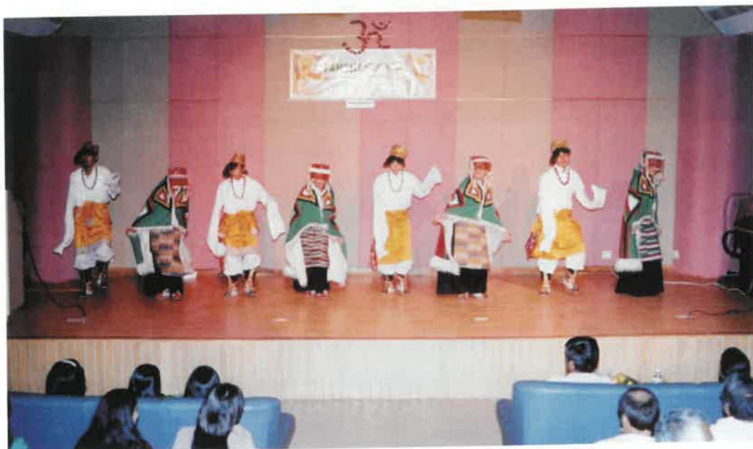
A view of Pancham Swar. a Socio-Cultural Programme