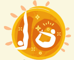
योग-बन्धन Yoga Bandhan

10 स्थानों पर एक सप्ताह तक चलने वाला उत्सव, जिसका समापन 21 जून, 2025 को अंतरराष्ट्रीय योग दिवस के मुख्य आयोजन के साथ होगा।