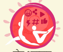
योग अनप्लग्ड Yoga Unplugged

एक वैश्विक योग शिखर सम्मेलन जिसमें प्रमुख योग विशेषज्ञ और स्वास्थ्य सेवा पेशेवर शामिल होंगे।