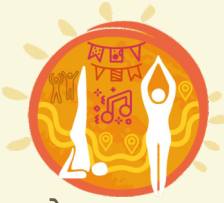
योग-महाकुम्भ Yoga Maha Kumbh

योग को पर्यावरण संरक्षण हेतु विभिन्न गतिविधियों के साथ जोड़ने वाली एक स्थिरता-संचालित पहल।