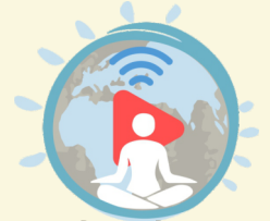
योग कनेक्ट Yoga Connect

दिव्यांगजनों, वरिष्ठ नागरिकों, बच्चों और विशेष आवश्यकताओं वाले अन्य समूहों के लिए विशेष योग कार्यक्रमों के माध्यम से योग के समावेशी चरित्र को प्रदर्शित करना।