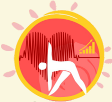
योग-प्रभाव Yoga Prabhava

योग से दीर्घकालिक सामुदायिक जुड़ाव हेतु 1,000 योग पार्कों का विकास।